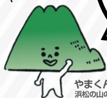
やまくん 浜松の山のソムリエ